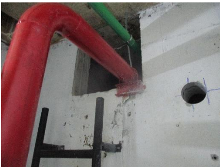
ถังเก็บน้ำใต้ดิน