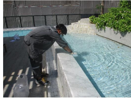
สระว่ายน้ำบริเวณส่วนตื้น