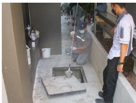
บ่อตรวจคุณภาพน้ำ