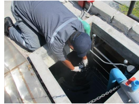
ถังเก็บน้ำชั้นดาดฟ้า